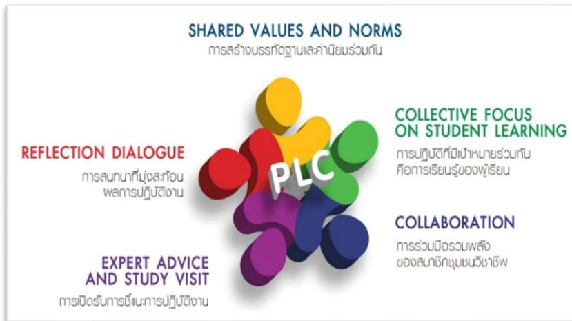
ภาพแสดงหลักการชุมชนแห่งการเรียนรู้ทางวิชาชีพ (PLC)

๓. การปฏิบัติการผ่านระบบเทคโนโลยีสารสนเทศและการสื่อสาร (Information and Communication Technology: ICT) โดยการส่งเสริมและพัฒนาจรรยาบรรณของวิชาชีพครูผ่านระบบเทคโนโลยีสารสนเทศและการสื่อสารจะสามารถสร้างเครือข่ายเชื่อมโยงระหว่างผู้ประกอบการวิชาชีพทางการศึกษาให้ตระหนักในจรรยาบรรณของวิชาชีพครูได้อย่างกว้างขวาง ครอบคลุมครูในทุกสังกัดและทุกกลุ่มเป้าหมาย ประหยัดทรัพยากร และเป็นการสร้างทักษะการใช้เทคโนโลยีสารสนเทศที่สอดคล้องกับทักษะในศตวรรษที่ ๒๑ ทุกคนสามารถเรียนรู้ได้ทุกเวลา และทุกสถานที่ (Learn for all : anyone, anywhere and anytime)