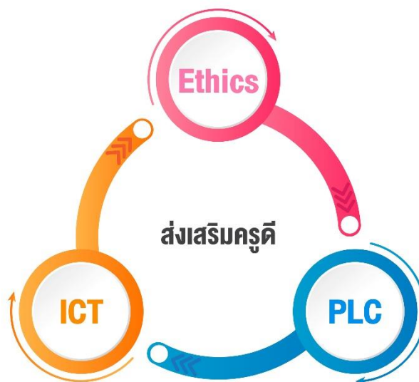
ภาพแสดงการบูรณาการหลักการสำคัญร่วมกัน ๓ ประการ ในโครงการ E-PLC

๓. การปฏิบัติการผ่านระบบเทคโนโลยีสารสนเทศและการสื่อสาร (Information and Communication Technology: ICT) โดยการส่งเสริมและพัฒนาจรรยาบรรณของวิชาชีพครูผ่านระบบเทคโนโลยีสารสนเทศและการสื่อสารจะสามารถสร้างเครือข่ายเชื่อมโยงระหว่างผู้ประกอบการวิชาชีพทางการศึกษาให้ตระหนักในจรรยาบรรณของวิชาชีพครูได้อย่างกว้างขวาง ครอบคลุมครูในทุกสังกัดและทุกกลุ่มเป้าหมาย ประหยัดทรัพยากร และเป็นการสร้างทักษะการใช้เทคโนโลยีสารสนเทศที่สอดคล้องกับทักษะในศตวรรษที่ ๒๑ ทุกคนสามารถเรียนรู้ได้ทุกเวลา และทุกสถานที่ (Learn for all : anyone, anywhere and anytime)